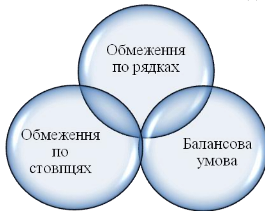
Рис. 2. Складові системи обмежень

Друга складова частина економіко-математичної моделі - система обмежень, яка має також свої складові частини (рис. 2).