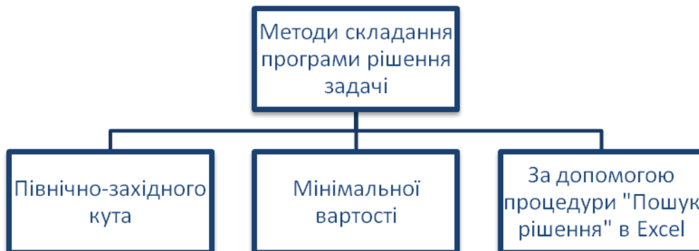
Рис. 3. Прогнозні методи складання програми рішення задачі

Прогнозне рішення задачі, що розглядається, складається з різних методів (рис. 3).