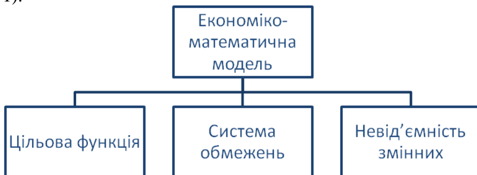
Рис. 1 Складові частини економіко-математичної моделі

Економіко-математична модель (ЕММ) складається з трьох складових частин (рис. 1).