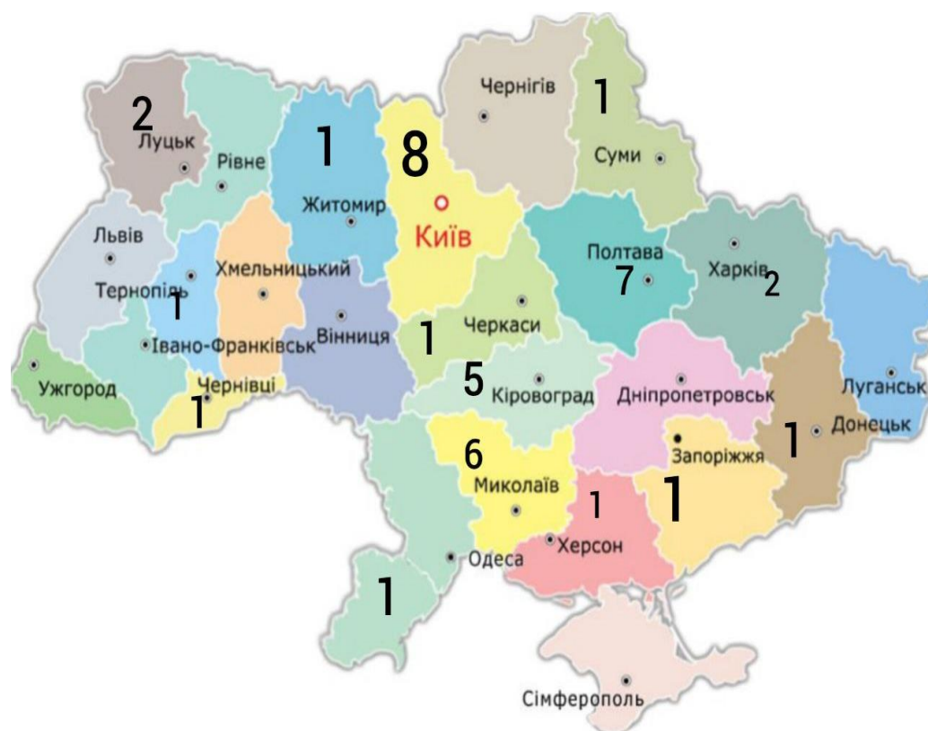
Рис. 3. Кількість виявлених випадків АЧС в областях України за 2024 рік.

Якщо брати Миколаївську область, то з початку року було підтверджено вже 6 випадків АЧС.