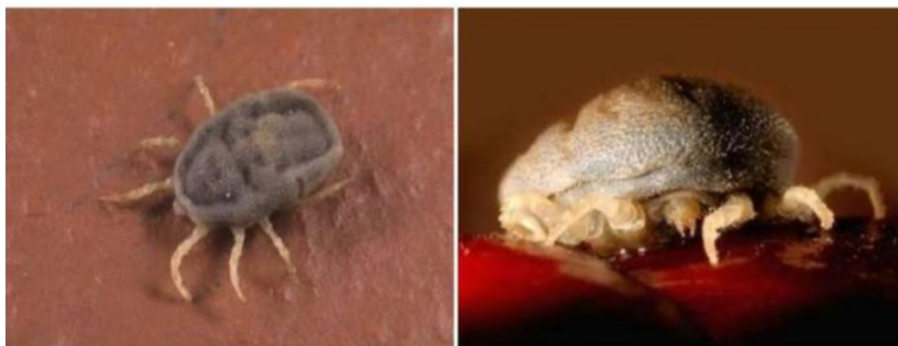
Рис. 2. Аргасові кліщі роду Ornithodoros

Резервуаром та переносником вірусу в країнах, стаціонарно-неблагополучних щодо АЧС, є аргасові кліщі роду Ornithodoros ( O. mubata в Африці, O. erraticus у Європі). Вони заражаються від інфікованих тварин (Рис. 2), [7].